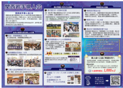
県人会紹介パンフレット

広報部では県人会の会員募集ポスターやチラシ、県人会を知っていただくためのパンフレットをつくりました。県人会をアピールするため会員の皆様に利用していただき、新会員獲得の一助になればと思います。