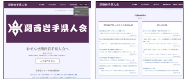
県人会ホームページ： http://www.iwate-kansai.com

県人会のホームページの「Information」の記事を開くか、メニューの右端にある「お知らせ・会報誌」を開くと、記事を確認できます。「関西岩手県人会からのお知らせ」には事務局からの様々な行事の予定や参加申し込みのお知らせが掲載されていますので、こまめに確認してください。「県人会広場」には「青森・岩手ええもんショップ」のお買い得情報や県産品販売の情報、各種イベントやお祭りなどの内容を紹介する投稿記事を掲載しています。大切なお知らせもありますので、必ずチェックしてください。