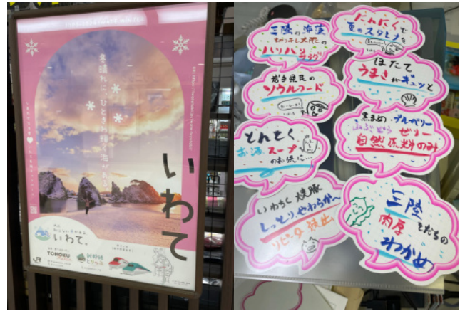
今年の冬の観光キャンペーンのポスターと、アンテナショップのセールスのため私が描いたPOPです。

当事務所及びアンテナショップのミッションとしては観光・物産情報の発信、企業誘致や交流拡大に向けた関係機関の支援等となります。いわて県民計画(2019~2028)の基本目標「東日本大震災津波の経験に基づき、引き続き復興に取り組みながら、お互いに幸福を守り育てる希望郷いわて」に貢献すべく、関西岩手県人会の皆様とともに、各種施策を実施し、故郷いわての発展につなげてまいりたいと思いますので、引き続きご協力いただきますようお願い申し上げます。