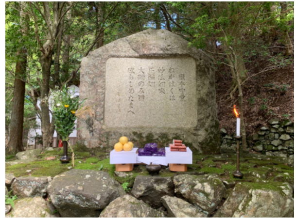
延暦寺根本中堂の横にある歌碑

本会にご入会の上、初秋のさわやかな比叡山を訪れ、賢治忌法要&記念講演会に参加されてはいかがでしょうか？