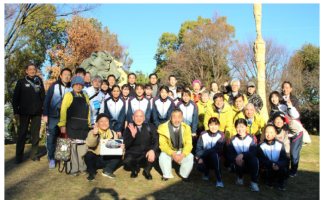
選手団と応援の皆さんと競技後の記念撮影

駅伝の結果は、我が岩手県は24位でした。各区の選手の順位を見ると中学生や高校生の選手の中に10位台があって若手が頑張りました。アンカーがスタジアムに入ってきたときは25位でしたが、第3コーナーで前の選手を追い抜いて24位でフィニッシュしました。競技が終わって岩手県人会の屋台に集合した選手は、温かいぜんざいを振舞われて笑顔で頬張っていました。皆がんばってくれました。これを見たら来年も応援しようと思いますね。(事務局N)