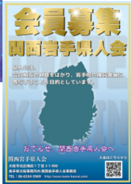
会員募集ポスター