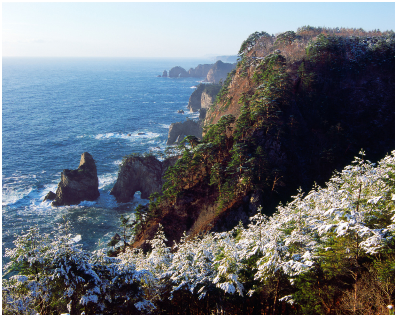
岩手県田野畑村 北山崎のなごり雪(2009年3月26日)